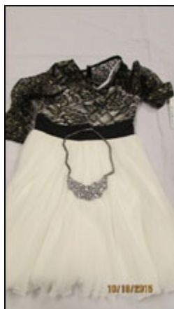
カドミウム98.4%検出された ジュエリーとドレス

非常に高濃度の重金属が検出され危険性が高いことから、日本においても検査をおすすめします!