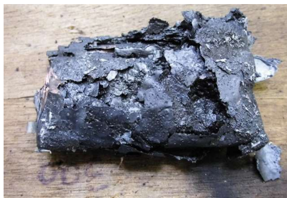
発火したリチウムイオンバッテリー