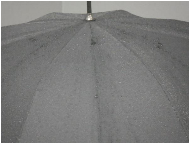
20mm/h での傘の耐漏水試験の様子

「ゲリラ豪雨」と言われる激しい雨量により試験を実施いたします。 例えば、傘の耐漏水性は従来 20\pm 2\text{mm/h} の雨量を 20 分間（J U P A 基準）実施していますが、当試験所では 100\text{mm/h} 以上の雨量を任意の時間（1 時間、2 時間）試験をすることが可能です。